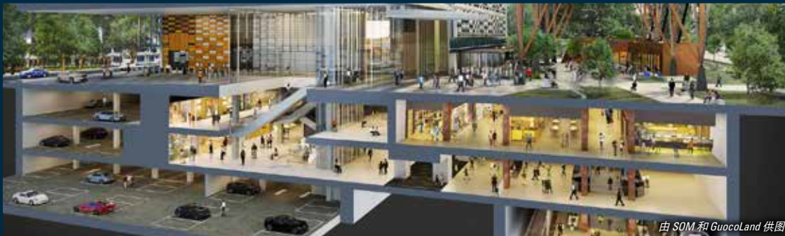
由 SOM 和 GuocoLand 供图