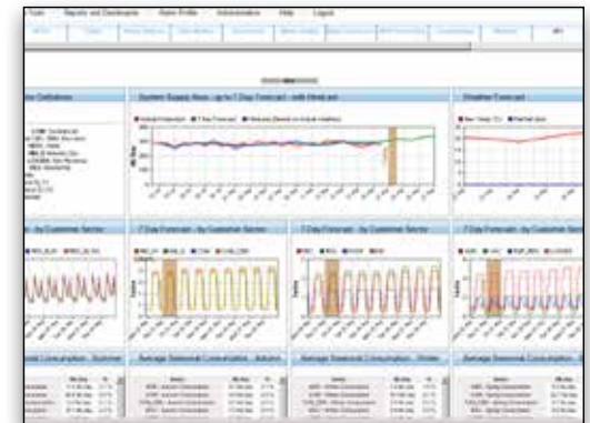
分析系统中的点以进行比较、形成模式和做出预测