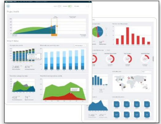
프로젝트 및 하청업체 성과를 파악해 보십시오.

성과 대시보드로 투명성을 높이고 프로젝트 성과를 관리할 수 있습니다. 지능형 쿼리, 성과 지표 및 문제를 인식하고 변화의 영향을 관리하는 데 필요한 동향 정보를 통해 문서 및 성과품 상태는 물론 하청업체 성과를 훨씬 효과적으로 파악할 수 있습니다.