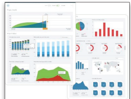
La transparence des projets est améliorée et les éventuels problèmes de gestion éliminés.